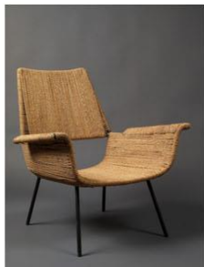
dizajnerica upotrebnih tekstila i namještaja — r. 1906.