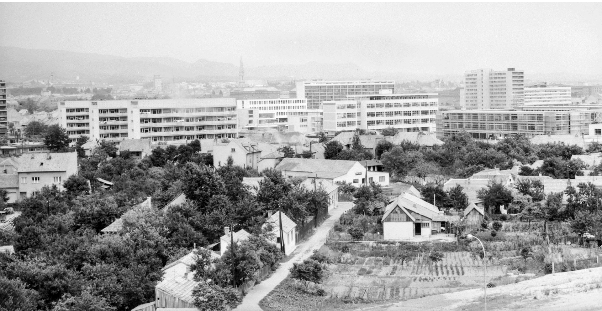
Branko Balić, pogled na Filozofski fakultet, Visoku školu za pogonske inženjere (danas Fakultet strojarstva i brodogradnje) i Radničko narodno sveučilište "Moša Pijade" (danas Pučko otvoreno učilište) u izgradnji, oko 1960.