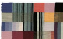
dizajnerica, umjetnica tekstila, profesorica — r. 1898.