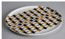
keramarka, dizajnerica posuđa — r. 1934.